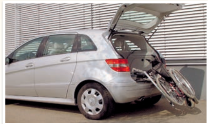
Rausch Ladeboy. Rollstuhlverladesysteme von Rausch gibt es für die Seitentür wie auch für den Kofferraum