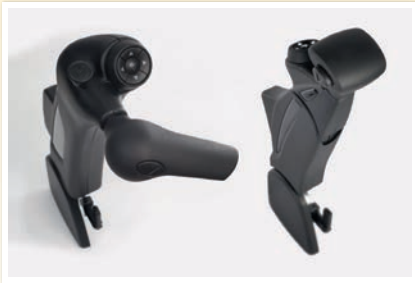
Handbediengerät. Veigel CLASSIC II und COMPACT II